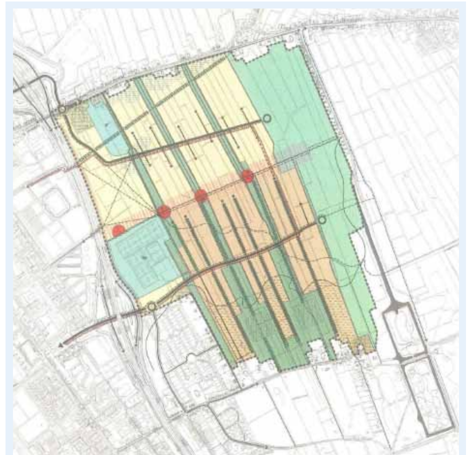
Figuur 4. Structuurplan 1998

Skoatterwâld 2e fase ligt grotendeels in het waterrijke gedeelte van Skoatterwâld en omvat alle terreinen tussen de 1e fase, de A32, Het Meer en het verlengde van de oostelijke begrenzing van de 1e planfase. Het gebied van de 3e fase betreft alle terreinen tussen de oostelijke grens van de 1e en 2e fase, (tevens de rand van de buitenplaats Heerenwoud) en de landschappelijk zone rond Oranjewoud waarmee een nauwe ruimtelijke relatie bestaat. De 3e fase en deze landschappelijk zone liggen deels in het bosrijke en deels in het waterrijke gedeelte van Skoatterwâld.