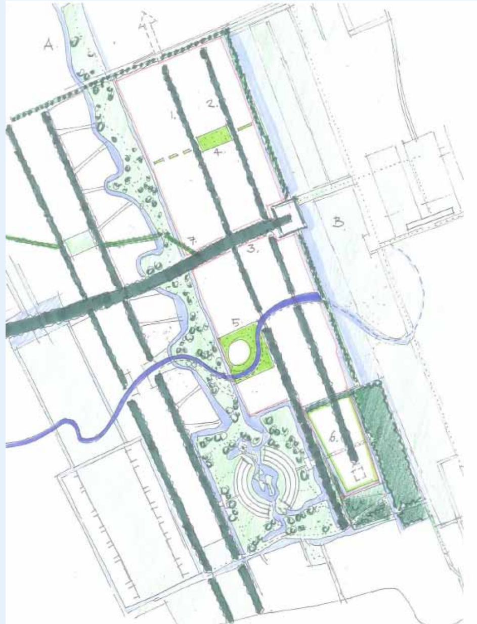
Figuur 3. Landschappelijk raamwerk