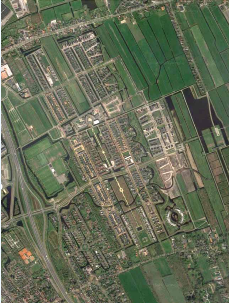
Figuur 2. Luchtfoto Skoatterwâld